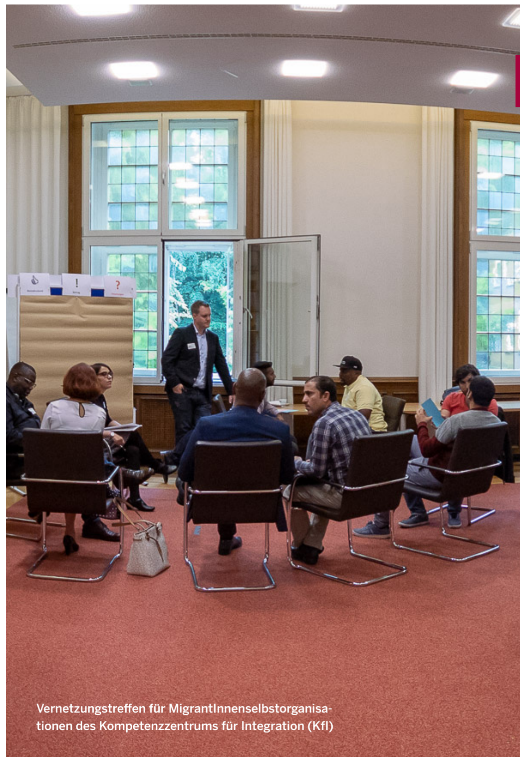
Vernetzungstreffen für MigrantInnenselbstorganisationen des Kompetenzzentrums für Integration (Kfi)

Mehr Informationen unter: www.kfi.nrw.de/Foerderprogramme/MSO