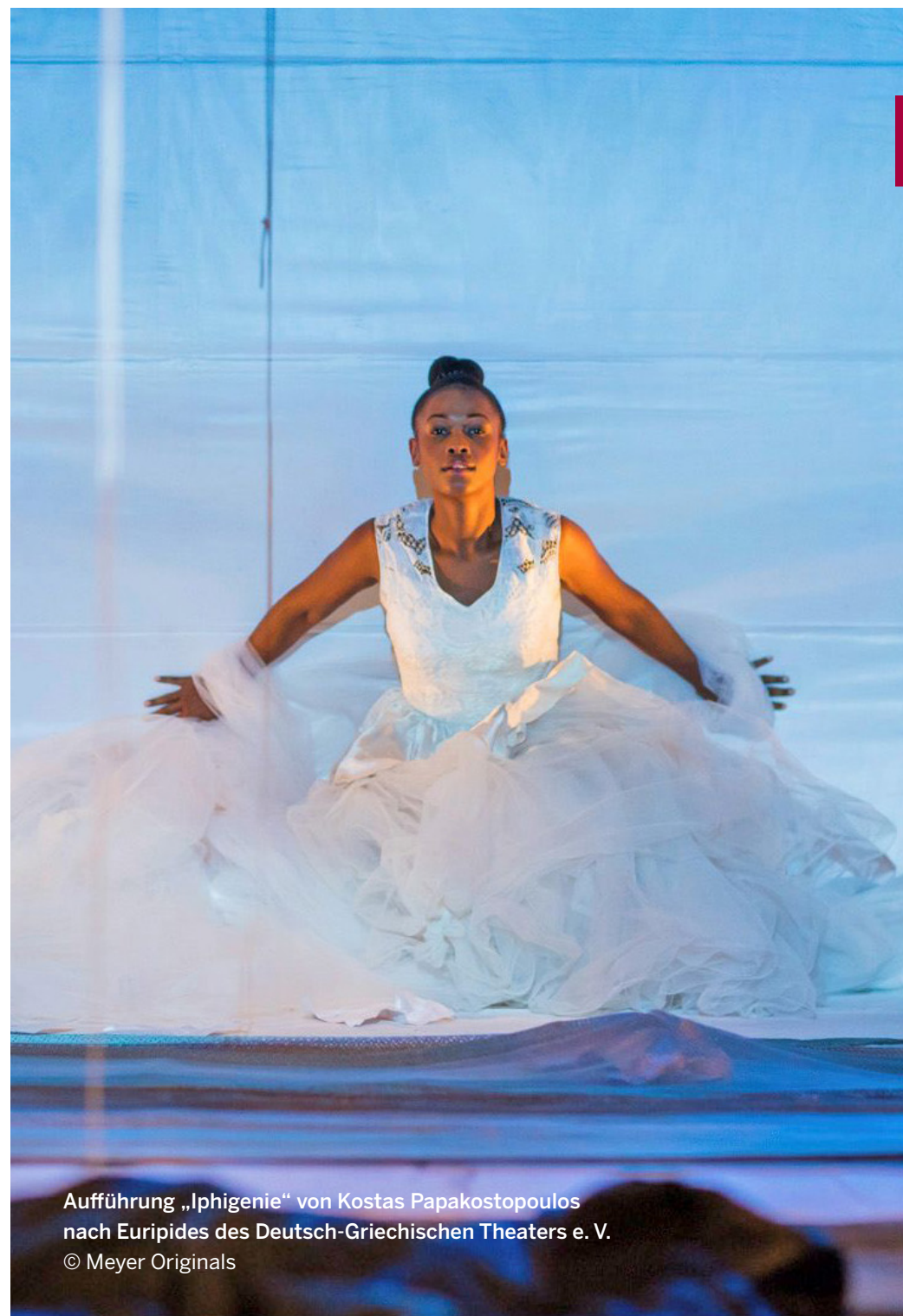
Aufführung „Iphigenie“ von Kostas Papakostopoulos nach Euripides des Deutsch-Griechischen Theaters e. V.