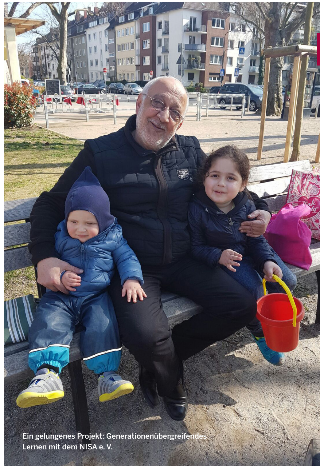
Ein gelungenes Projekt: Generationenübergreifendes Lernen mit dem NISA e. V.

www.paritaet-nrw.org/soziale-arbeit/themen/migration/migrantenselbsthilfe