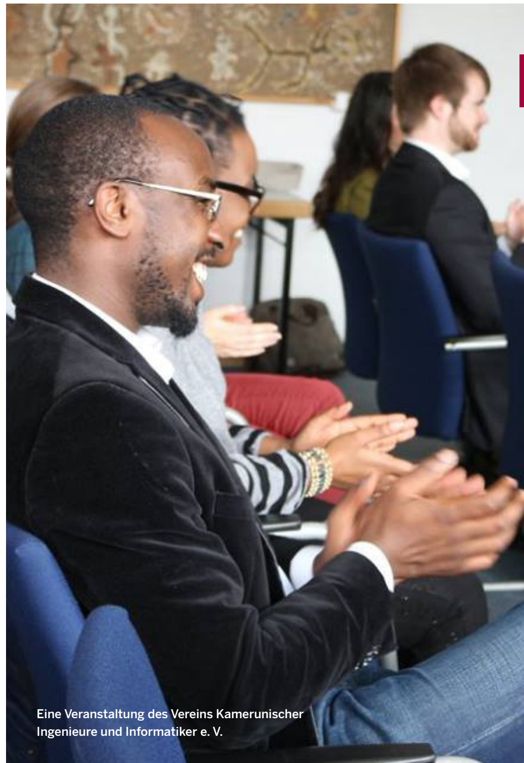
Eine Veranstaltung des Vereins Kamerunischer Ingenieure und Informatiker e. V.

Mehr Informationen unter: www.elternnetzwerk-nrw.de